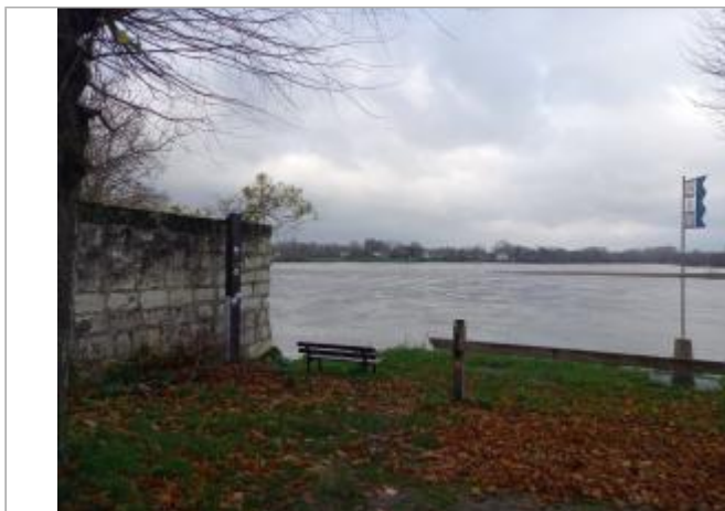
Poteau place du confluent

Coordonnées WGS84 : X: 0.07489217 / Y: 47.21189880