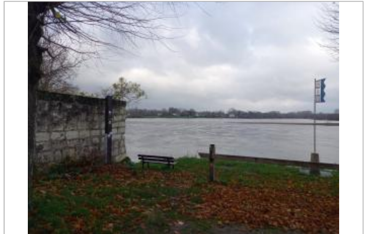
Poteau place du confluent