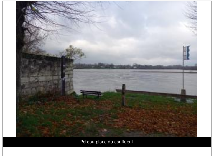
Poteau place du confluent