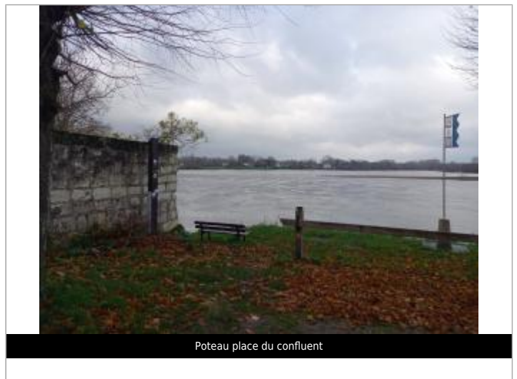
Poteau place du confluent

GÉOLOCALISATION Coordonnées WGS84 : X: 0.07489217 / Y: 47.21189880 Coordonnées RGF93 (Lambert 93) X: 478653.82 / Y: 6683167.43 Coordonnées RGF93 (ETRS89) : X: 0.0748922 / Y: 47.2118988 Code Hydro: L---0060 Rive de référence: Gauche