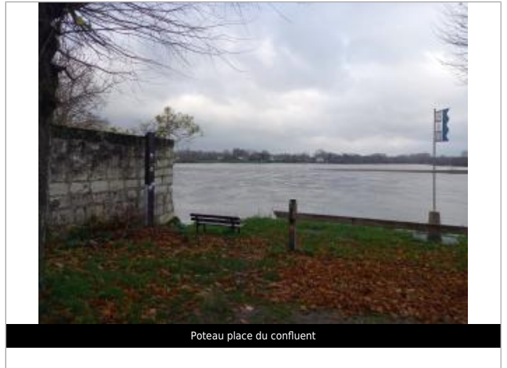
Poteau place du confluent