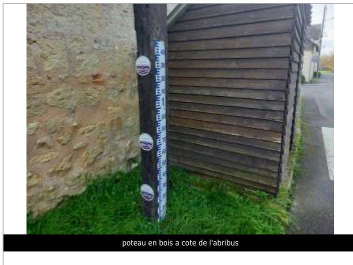
poteau en bois a cote de l'abribus