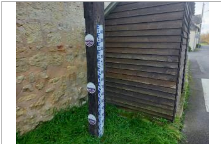
poteau en bois a cote de l'abribus