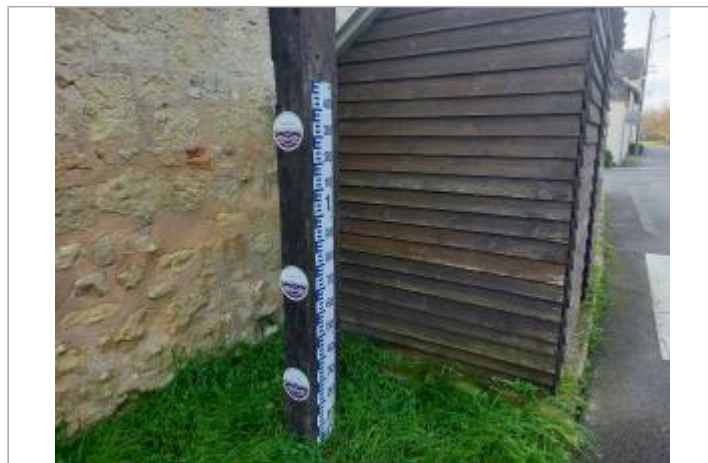
poteau en bois a cote de l'abribus