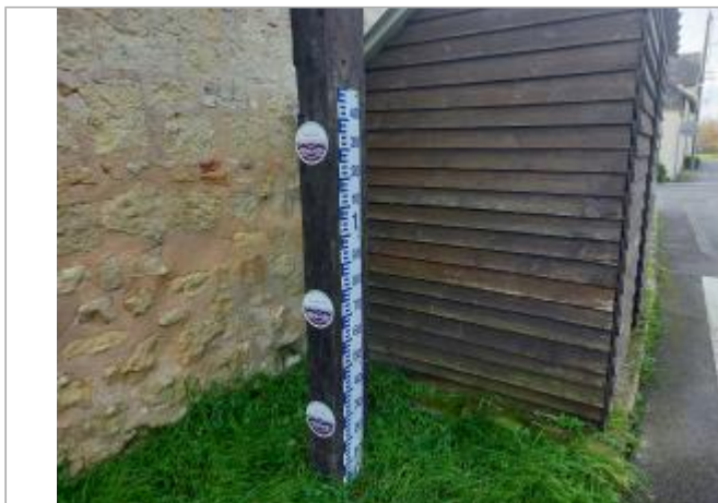
poteau en bois a cote de l'abribus