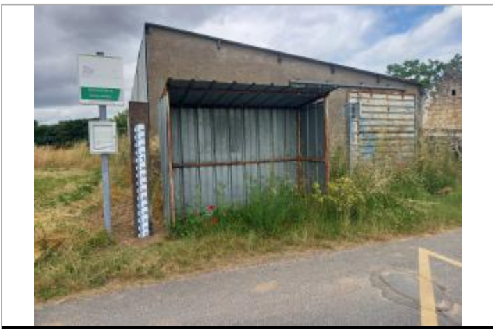
abribus du montachamps

GÉOLOCALISATION Coordonnées WGS84 : X: 0.09643021 / Y: 47.26503120 Coordonnées RGF93 (Lambert 93) X: 480499.87 / Y: 6689005.17 Coordonnées RGF93 (ETRS89) : X: 0.0964302 / Y: 47.2650312