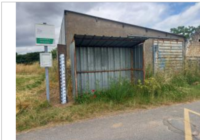
abribus du montachamps