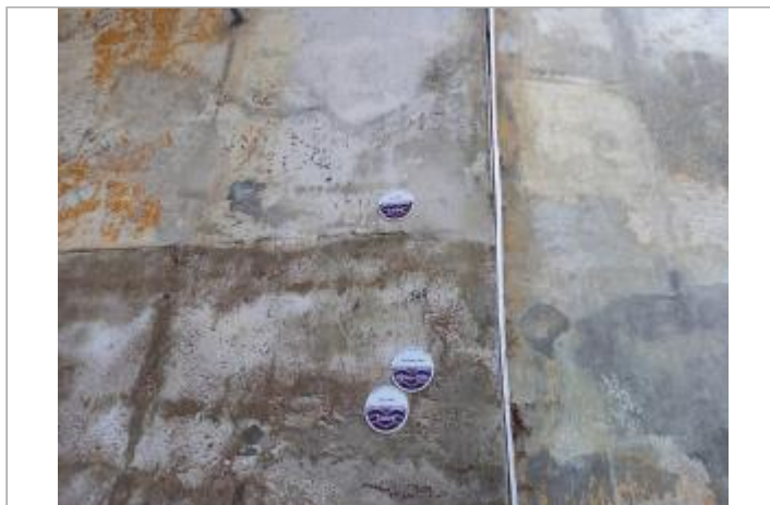
Sous le pont vers la loire à Vélo

Coordonnées WGS84 : X: 0.08128681 / Y: 47.21116100