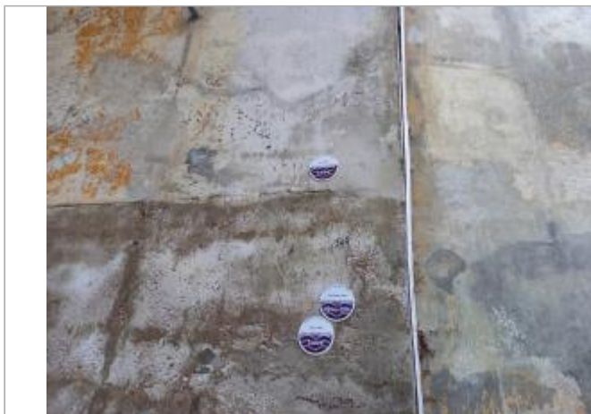
Sous le pont vers la loire à Vélo

Coordonnées WGS84 : X: 0.08128681 / Y: 47.21116100