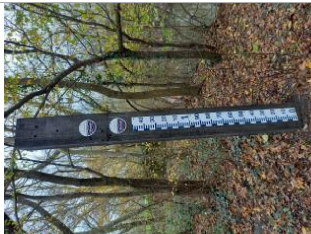
poteau au niveau du bois de la veude

Coordonnées WGS84 : X: 0.28834767 / Y: 47.14212930