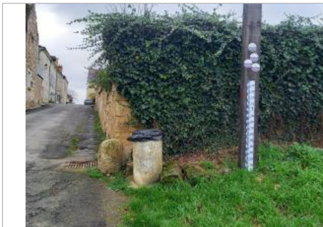
Poteau en bois rue du port

Coordonnées WGS84 : X: 0.27832974 / Y: 47.14728970