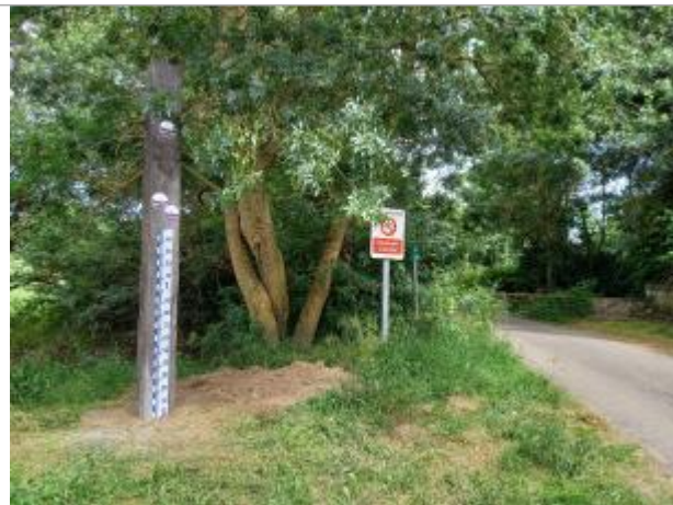
sur poteau en bois au niveau de negron