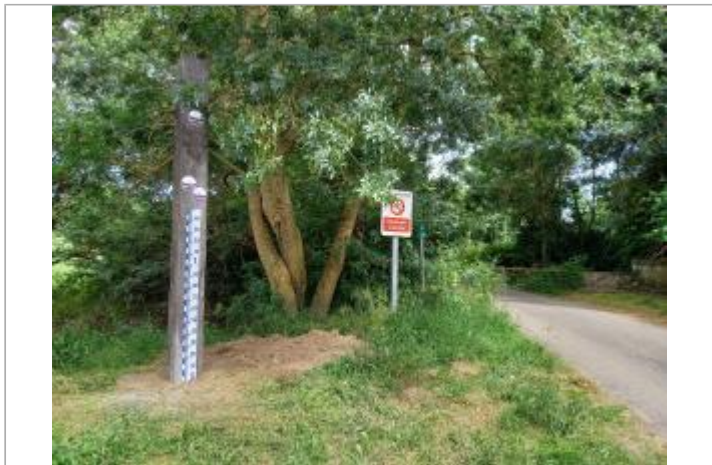
sur poteau en bois au niveau de negron

GÉOLOCALISATION Coordonnées WGS84 : X: 0.18880705 / Y: 47.17205460 Coordonnées RGF93 (Lambert 93) : X: 487112.64 / Y: 6678431.36 Coordonnées RGF93 (ETRS89) : X: 0.1888071 / Y: 47.1720546 Code Hydro: L---0060 Rive de référence: Gauche