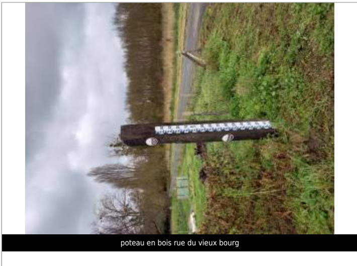
poteau en bois rue du vieux bourg

GÉOLOCALISATION Coordonnées WGS84 : X: 0.31034277 / Y: 47.13706050 Coordonnées RGF93 (Lambert 93) X: 496180.34 / Y: 6674226.05 Coordonnées RGF93 (ETRS89) : X: 0.3103428 / Y: 47.1370605 Code Hydro: L---0060 Rive de référence: Gauche