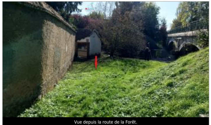
Vue depuis la route de la Forêt.

Coordonnées WGS84 : X: 1.40137537 / Y: 48.76890400