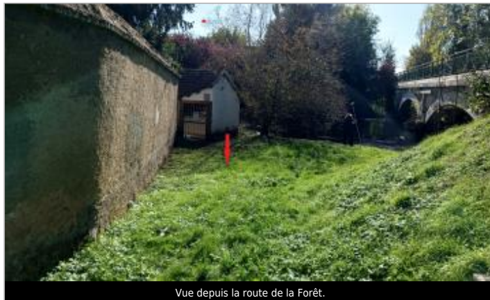
Vue depuis la route de la Forêt.