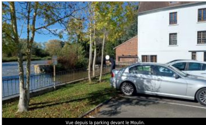
Vue depuis la parking devant le Moulin.