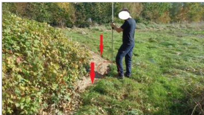
Vue depuis le sentier.

Coordonnées WGS84 : X: 1.41659852 / Y: 48.74659520