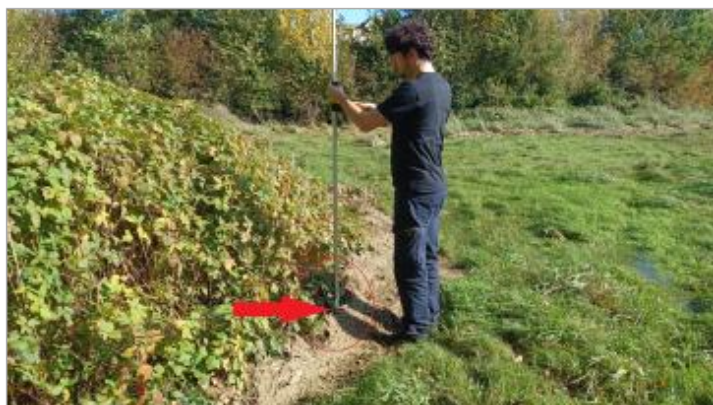
Laisse de crue au sol.

SOURCE DE REPÉRAGE : VISITE DE TERRAIN SPC SACN - 11/03/2020