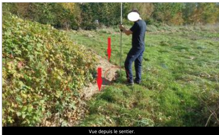
Vue depuis le sentier.