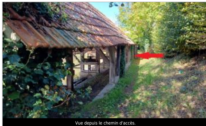
Vue depuis le chemin d'accès.

GÉOLOCALISATION Coordonnées WGS84 : X: 1.41833333 / Y: 48.74575750 Coordonnées RGF93 (Lambert 93) X: 583708.11 / Y: 6850680.5 Coordonnées RGF93 (ETRS89) : X: 1.4183333 / Y: 48.7457575 Code Hydro: H4--0200 Rive de référence: Droite