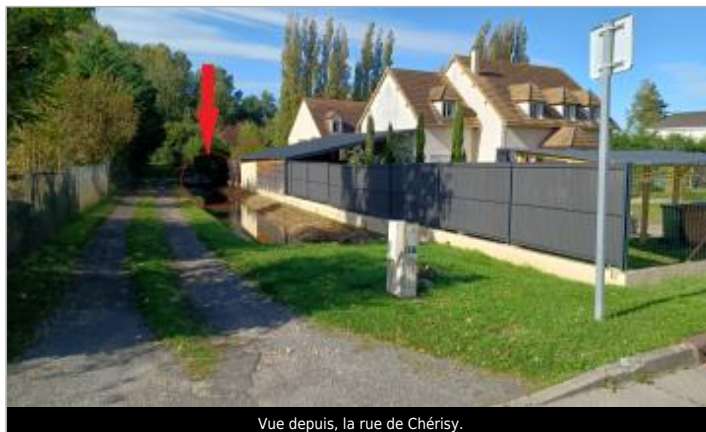
Vue depuis, la rue de Chérisy.