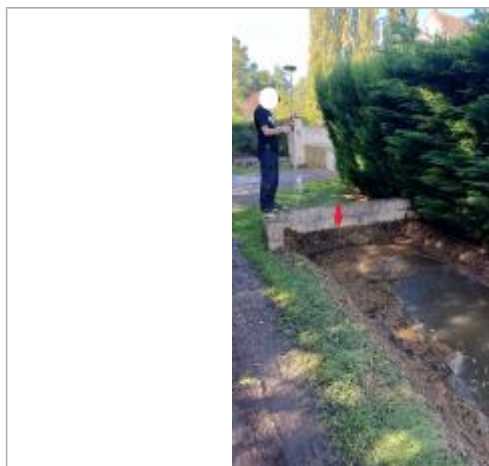
Laisse de crue à -38 cm/ haut du muret.

Altitude calculée de l'eau (en m) : 79.33