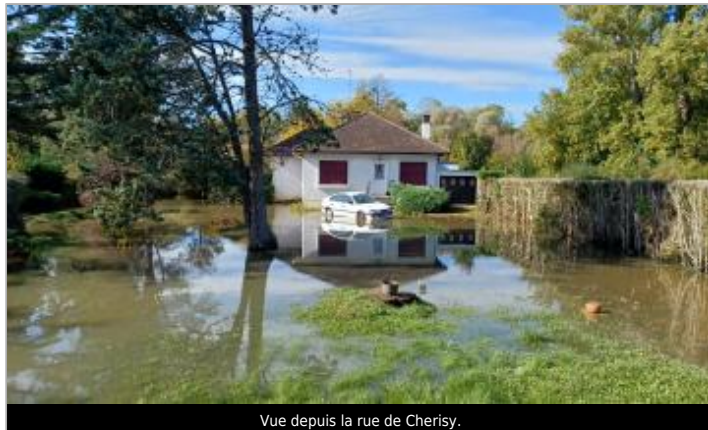
Vue depuis la rue de Chérisy.