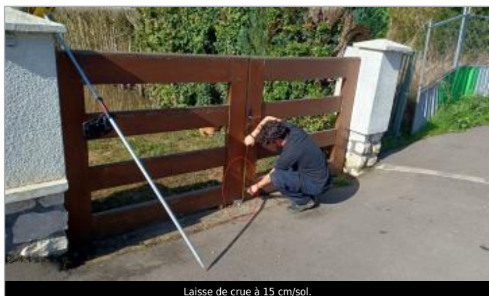
Laisse de crue à 15 cm/sol.

SOURCE DE REPÉRAGE : VISITE DE TERRAIN SPC SACN - 11/03/2020