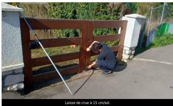
Laisse de crue à 15 cm/sol.

SOURCE DE REPÉRAGE : VISITE DE TERRAIN SPC SACN - 11/03/2020