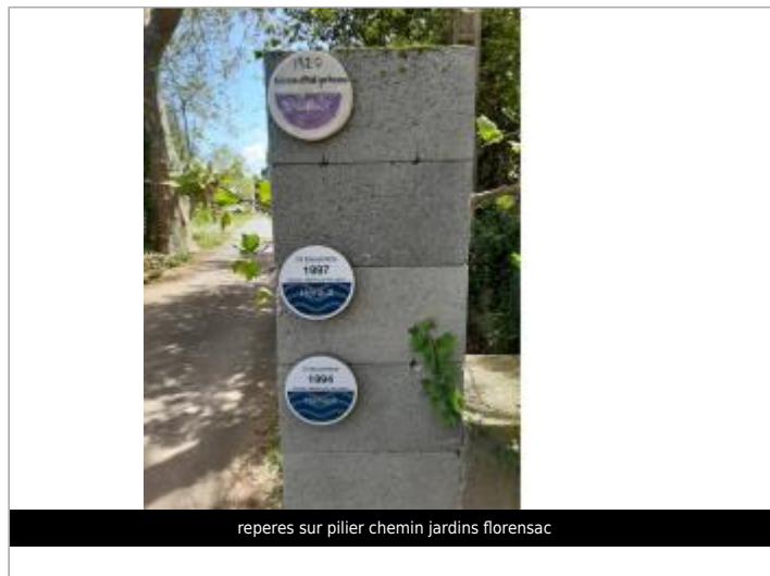
reperes sur pilier chemin jardins florensac