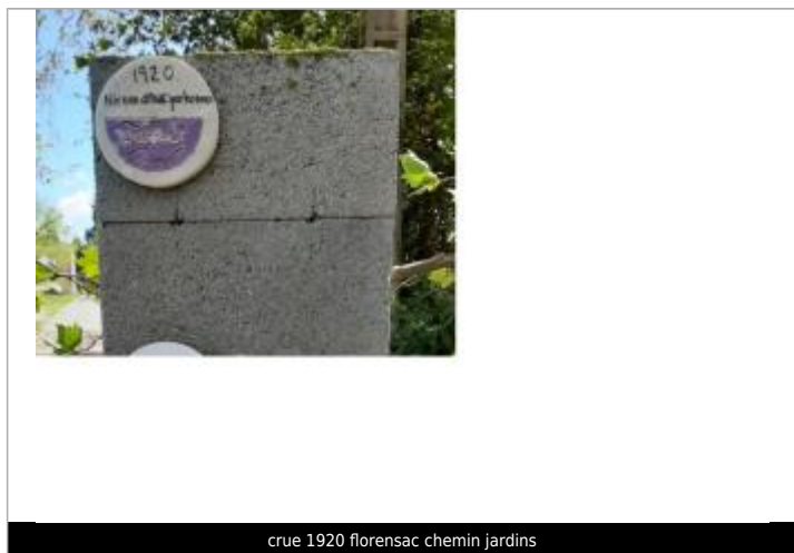
crue 1920 florensac chemin jardins

Maximum de l'inondation : Oui Visibilité : Oui État du repère : Bon Pérennité : Moyenne