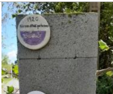
crue 1920 florensac chemin jardins

Système altimétrique : NGF IGN 1969 (système normal)