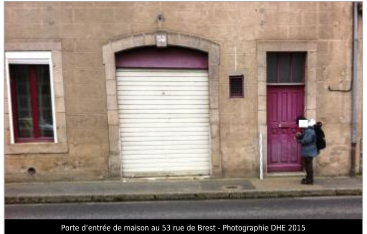
Porte d'entrée de maison au 53 rue de Brest

Coordonnées WGS84 : X: -3.83080690 / Y: 48.57494000