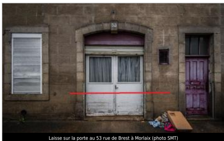
Laisse sur la porte au 53 rue de Brest à Morlaix

Altitude calculée de l'eau (en m) : 8.83 m