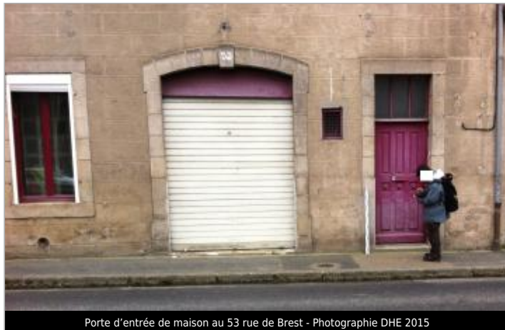
Porte d'entrée de maison au 53 rue de Brest