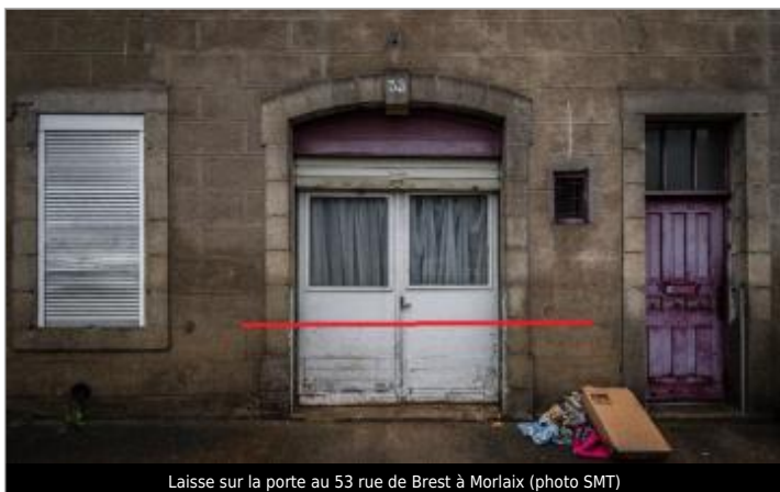
Laisse sur la porte au 53 rue de Brest à Morlaix