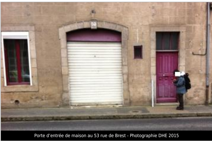
Porte d'entrée de maison au 53 rue de Brest

GÉOLOCALISATION Coordonnées WGS84 : X: -3.83080690 / Y: 48.57494000 Coordonnées RGF93 (Lambert 93) X: 196717.4 / Y: 6852307.26 Coordonnées RGF93 (ETRS89) : X: -3.8308069 / Y: 48.57494 Code Hydro: J2614000 Rive de référence: Gauche