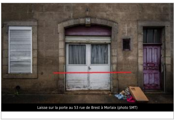
Laisse sur la porte au 53 rue de Brest à Morlaix

MARQUE Maximum de l'inondation : Oui Visibilité : Non État du repère : Disparu Pérennité : Aucune Repère calculé : Oui PHEC : Non