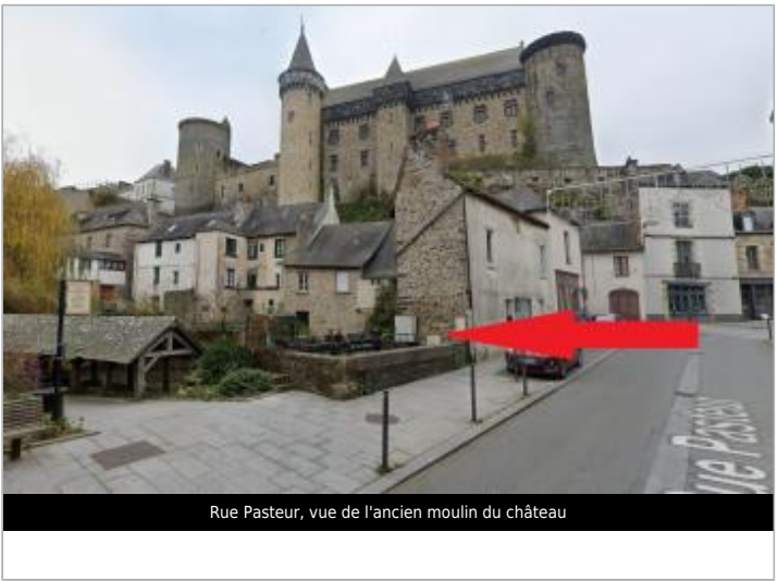
Rue Pasteur, vue de l'ancien moulin du château