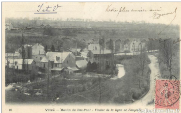
Carte postale ancienne du moulin du Bas-Pont

Coordonnées WGS84 : X: -1.22193070 / Y: 48.12356100