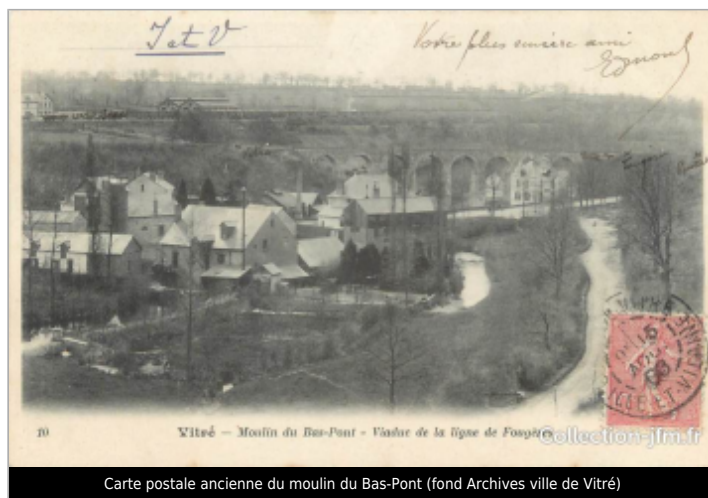
Carte postale ancienne du moulin du Bas-Pont

GÉOLOCALISATION Coordonnées WGS84 : X: -1.22193070 / Y: 48.12356100 Coordonnées RGF93 (Lambert 93) X: 386013.95 / Y: 6788750.63 Coordonnées RGF93 (ETRS89) : X: -1.2219307 / Y: 48.123561 Code Hydro: J---0060 Rive de référence: Gauche