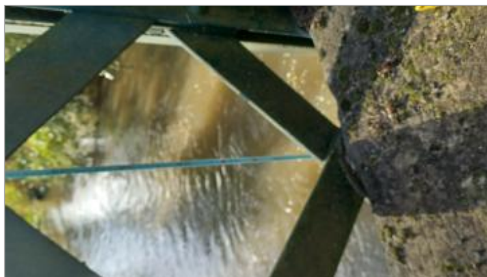
Niveau de l'eau à 1.94 m au ruban + 0.70 m soit à 2.64 m

SOURCE DE REPÉRAGE : VISITE DE TERRAIN SPC SACN - 11/03/2020