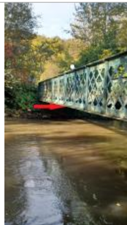
Vue du pont depuis la rue des Passerelles.