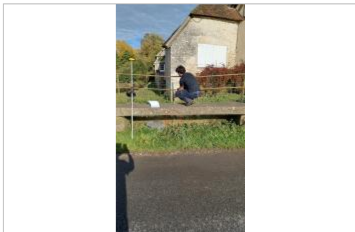
Laisse de crue à 30 cm/sol

SOURCE DE REPÉRAGE : VISITE DE TERRAIN SPC SACN - 11/03/2020