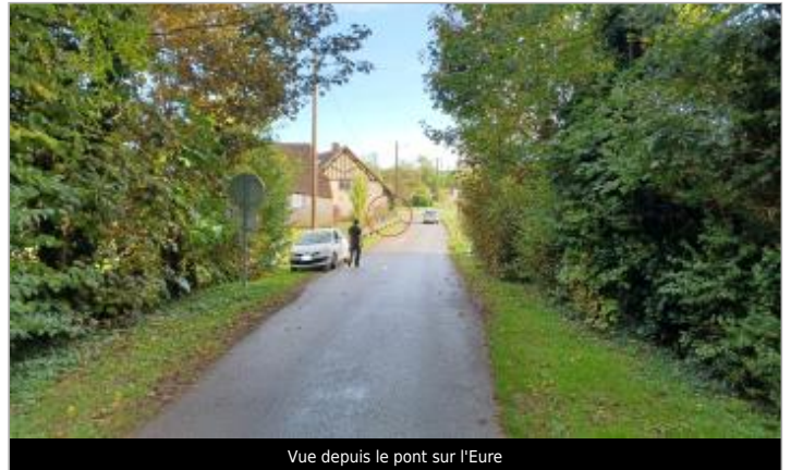
Vue depuis le pont sur l'Eure