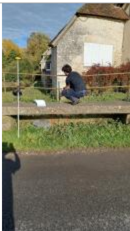
Laisse de crue à 30 cm/sol