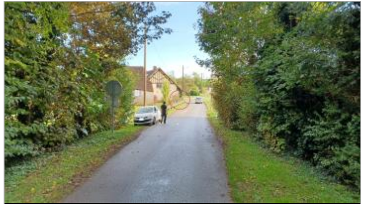
Vue depuis le pont sur l'Eure

Coordonnées WGS84 : X: 1.44947990 / Y: 48.68597660