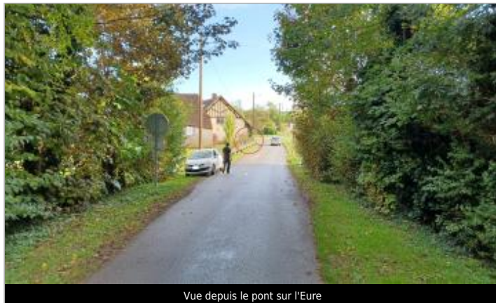
Vue depuis le pont sur l'Eure