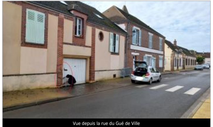
Vue depuis la rue du Gué de Ville

Coordonnées WGS84 : X: 1.46291339 / Y: 48.67512530