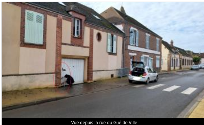
Vue depuis la rue du Gué de Ville