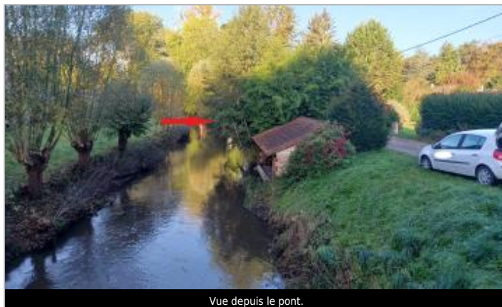
Vue depuis le pont.