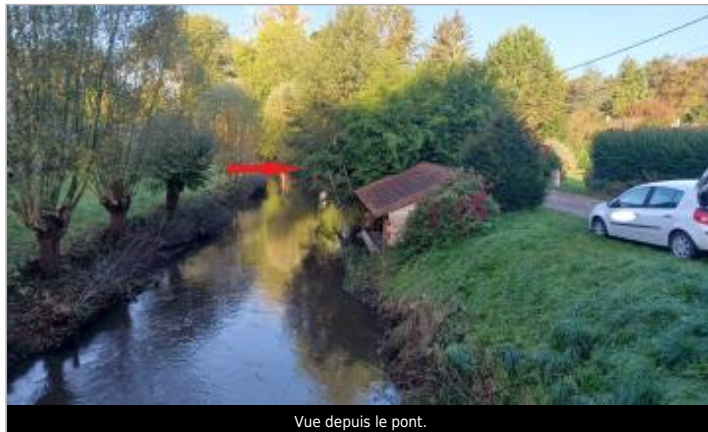
Vue depuis le pont.