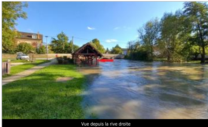
Vue depuis la rive droite