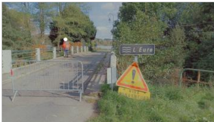
Vue depuis la rue du Péage coté Lormaye.