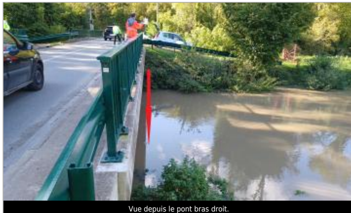
Vue depuis le pont bras droit.