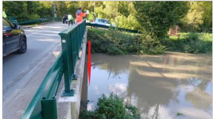
Vue depuis le pont bras droit.

Coordonnées WGS84 : X: 1.54833858 / Y: 48.62057480