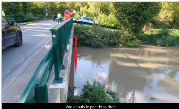
Vue depuis le pont bras droit.