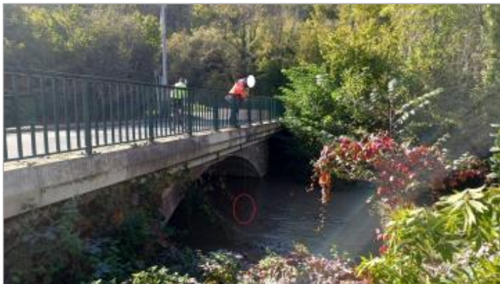
Le niveau de l'eau mesuré au centre du pont atteint - 253 cm sous le tablier du pont.