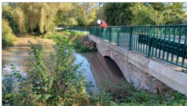
L'eau atteint le niveau -208 cm sous le tablier du pont.

SOURCE DE REPÉRAGE : VISITE DE TERRAIN SPC SACN - 11/03/2020