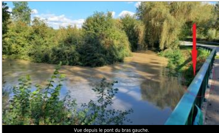
Vue depuis le pont du bras gauche.