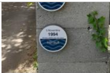
Repère posé sur le pilier

Système altimétrique : NGF IGN 1969 (système normal)