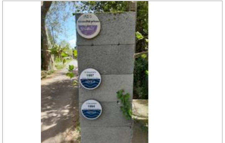
reperes sur pilier chemin jardins florensac