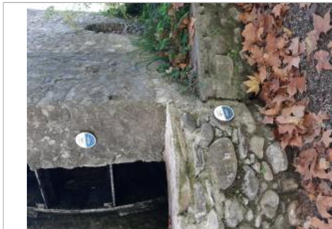
Repère posé sur la roue

Système altimétrique : NGF IGN 1969 (système normal)