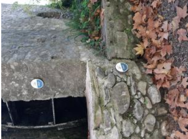
Repères posés sur la roue

Altitude calculée de l'eau (en m) : 144 m