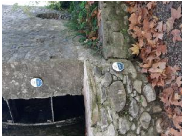
Repères posés sur la roue