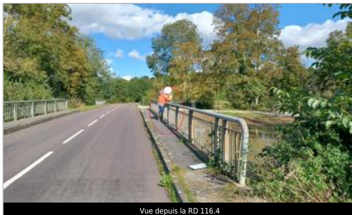
Vue depuis la RD 116.4