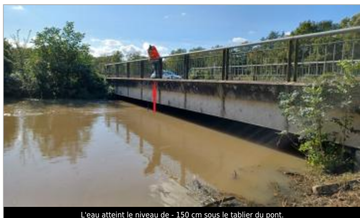
L'eau atteint le niveau de - 150 cm sous le tablier du pont.

SOURCE DE REPÉRAGE : VISITE DE TERRAIN SPC SACN - 11/03/2020