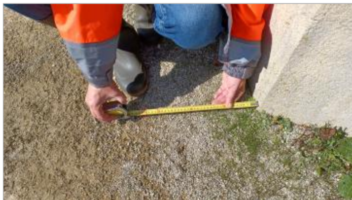
Laisse de crue au sol à 35 cm de l'arrête du mur.