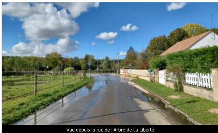
Vue depuis la rue de l'Arbre de La Liberté.