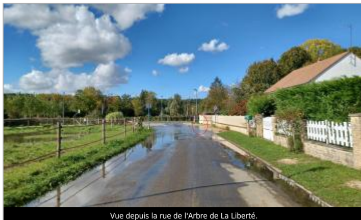
Vue depuis la rue de l'Arbre de La Liberté.

Coordonnées WGS84 : X: 1.58847749 / Y: 48.55191620