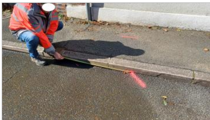
Laisse de crue au sol à 106 cm de l'avaloir

SOURCE DE REPÉRAGE : VISITE DE TERRAIN SPC SACN - 11/03/2020