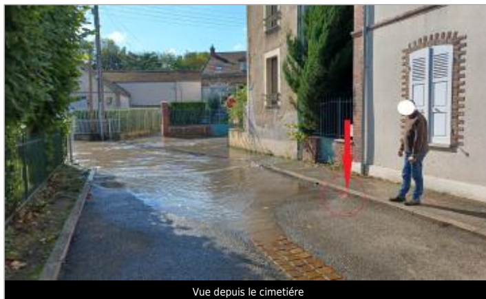
Vue depuis le cimetière