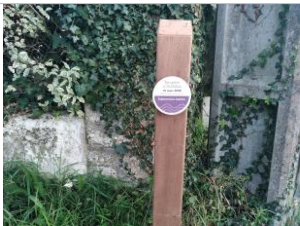
Repère de submersion - Pencadenic - Tempête Johanna - 10 mars 2008

Altitude calculée de l'eau (en m) : 3.49 m