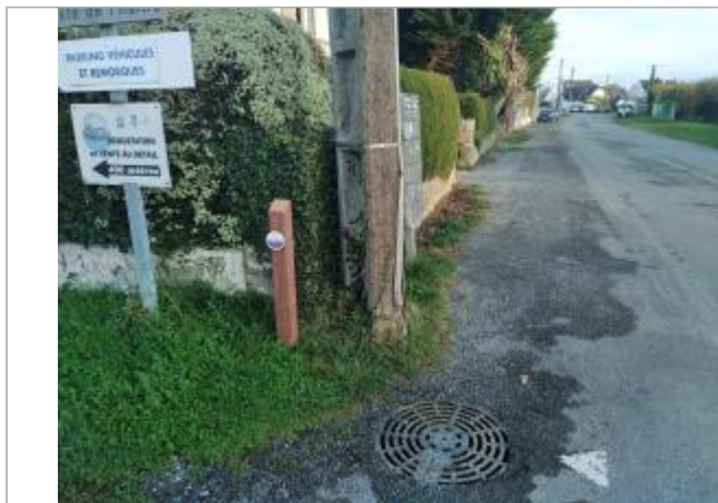
Pencadenic - Le Tour-du-Parc