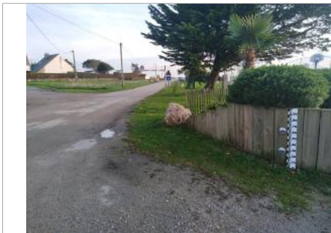
Camping municipal du Tour-du-Parc