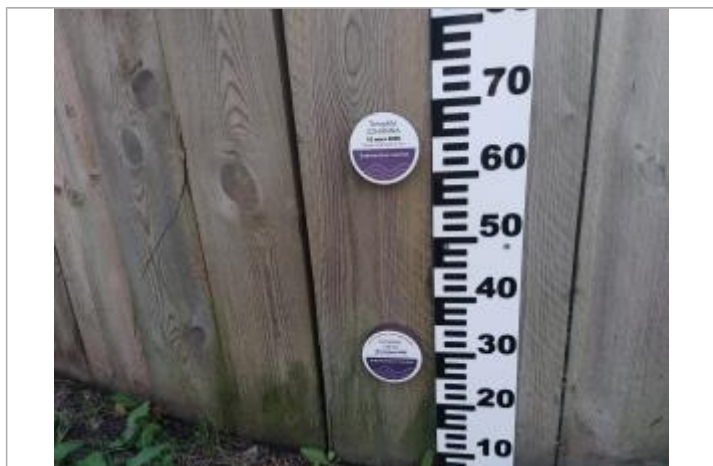
Repère de submersion - Camping - Tempête Johanna - 10 mars 2008

Altitude calculée de l'eau (en m) : 4.42