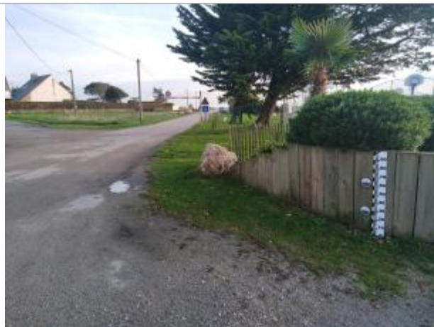
Camping municipal du Tour-du-Parc