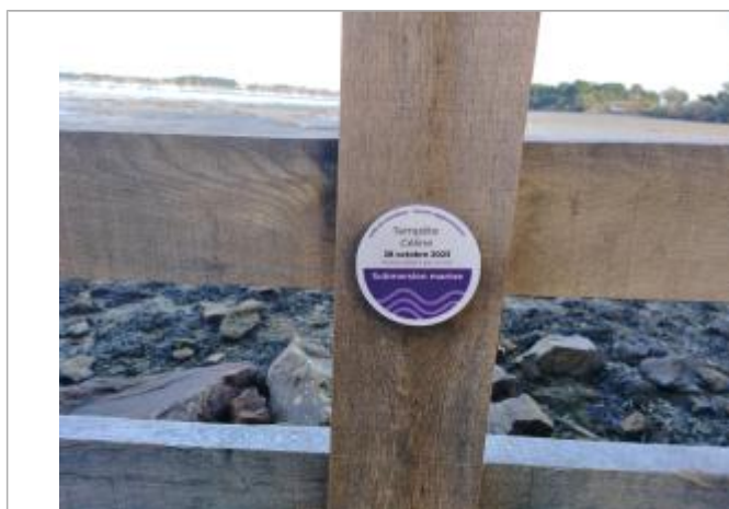
Repère de submersion Kervegan tempête Céline 28/10/2023

Texte : Tempête Céline - 28 octobre 2023