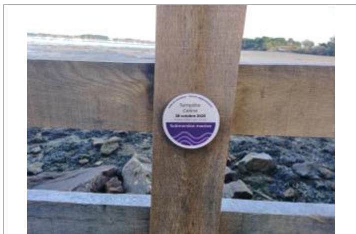
Repère de submersion Kervegan tempête Céline 28/10/2023

Altitude calculée de l'eau (en m) : 3.07