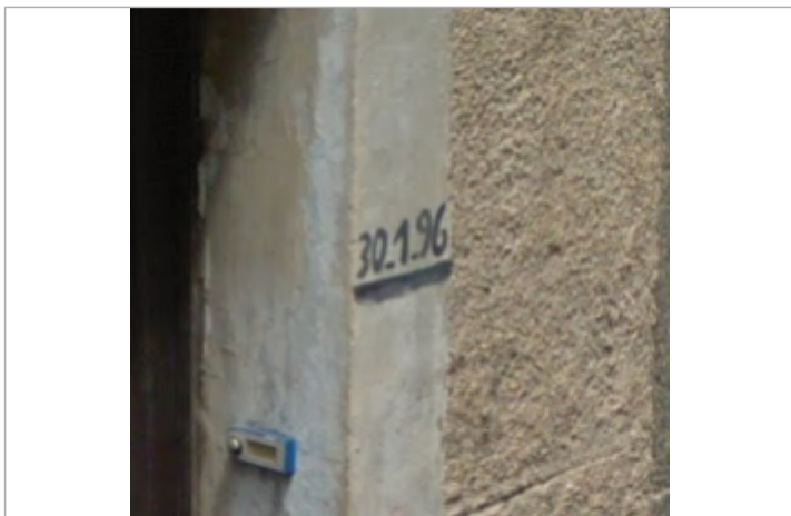
Vue du repère

SOURCE DE REPÉRAGE : RECENSEMENT DE MARQUES DANS LE CADRE DU PAPI VIENNE-CLAIN -