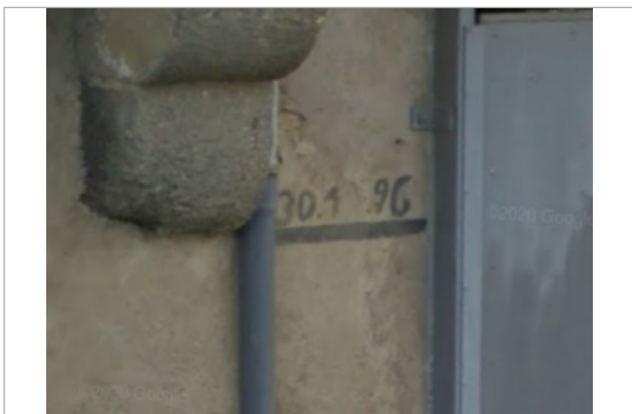
Vue du repère

Texte : 30-01-1996 Maximum de l'inondation : Oui Visibilité : Oui État du repère : Moyen Pérennité : Moyenne