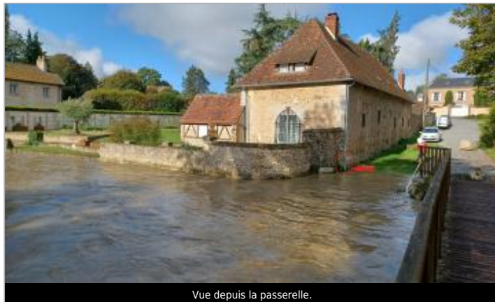
Vue depuis la passerelle.