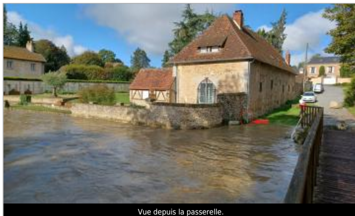
Vue depuis la passerelle.