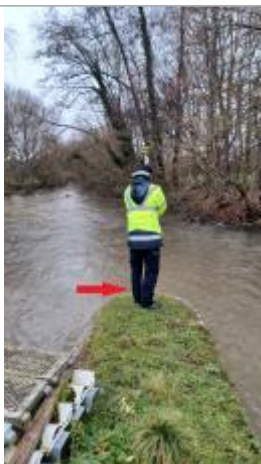
Nivellement du haut du muret.

Altitude calculée de l'eau (en m) : 114.72