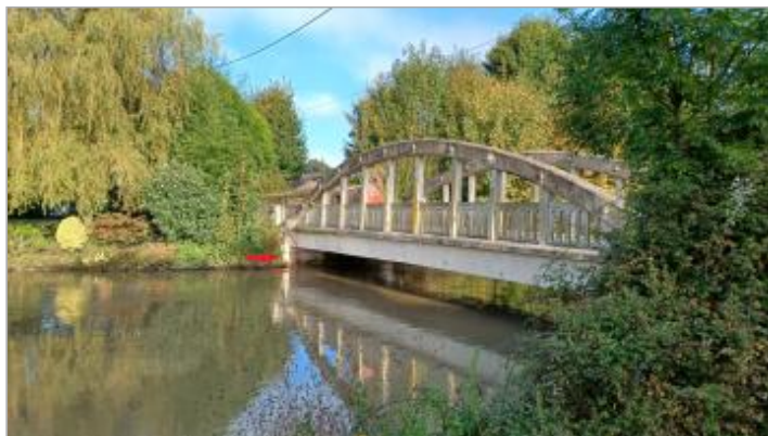
Vue de la rive droite.

Coordonnées WGS84 : X: 1.53317040 / Y: 48.49170740