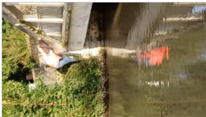
Laisse de crue à -90 cm du haut du muret.