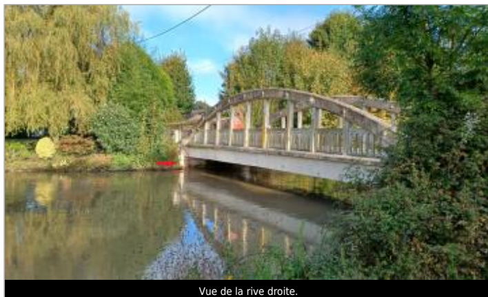
Vue de la rive droite.