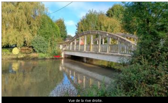
Vue de la rive droite.